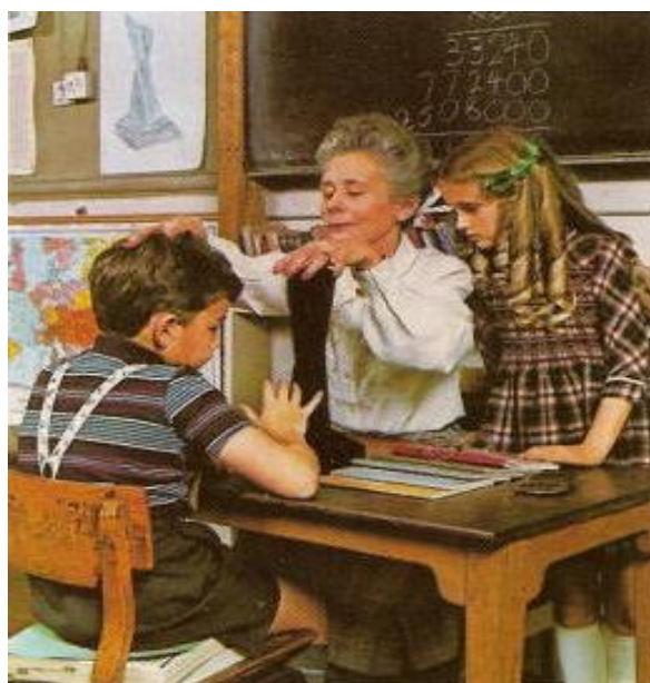
Na albu 'Presence' (1976) skupiny Led Zeppelin je zobrazen černý obelisk symbolizující magickou sílu, která má prý na svědomí úspěch skupiny. Na zadní straně obalu LP vidíme, jak jakási učitelka vkládáním rukou přenáší magickou, démonickou energii obelisku na své žáky.

U řady obalů desek se přímo nabízí domněnka, že jsou výplodem démonického nebo drogami inspirovaného umění. Je veřejným tajemstvím, že skutečně existují malíři, kteří nechávají své ruce vést démonickým duchem. Tak např. přehled anglických malířů příznačně uvádí, že 57 umělců je „spiritistickými malíři“, kteří se ve své tvorbě specializovali na zobrazování duchů a strašidel na anglických zámcích. 89